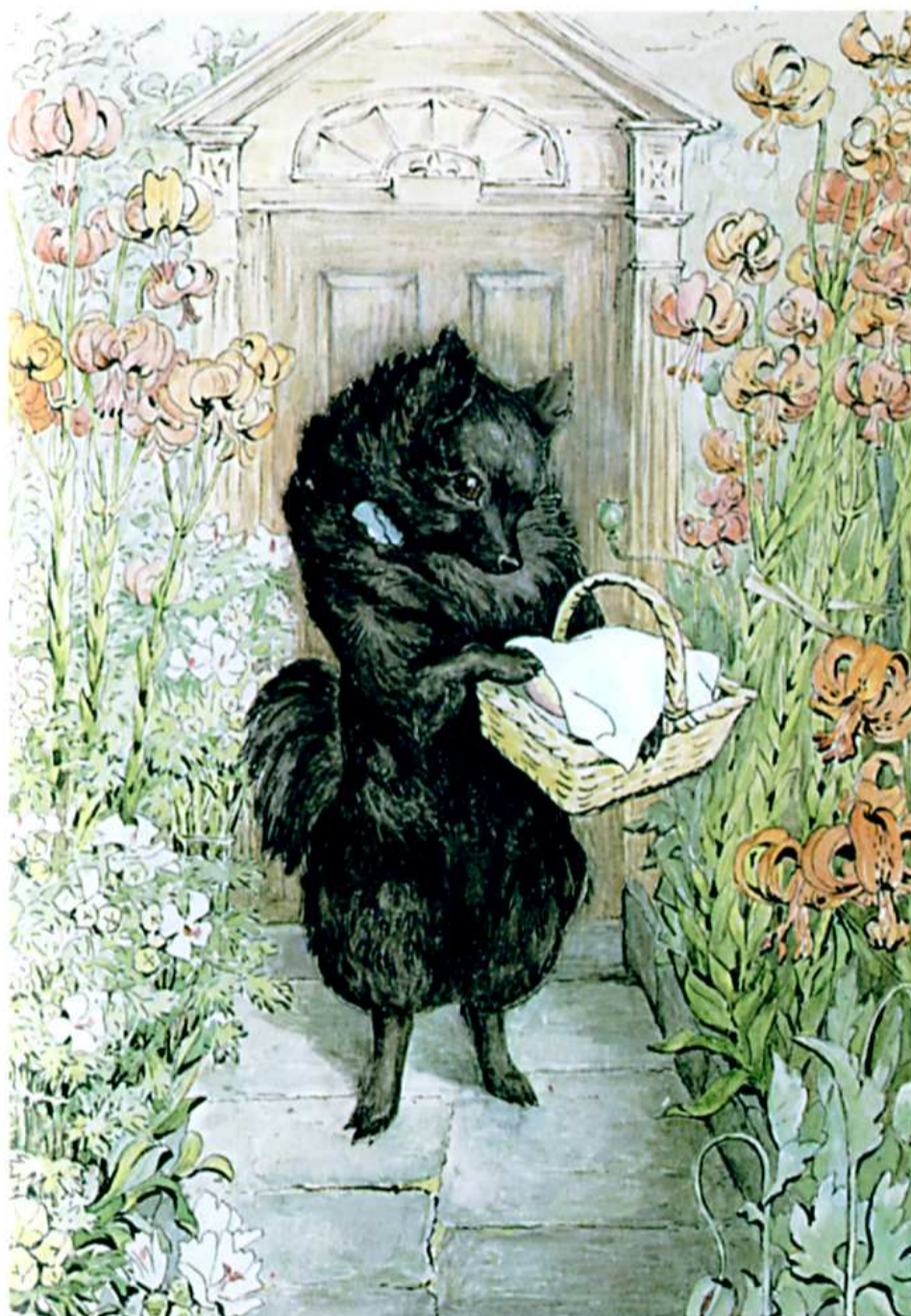
THE VEAL AND HAM PIE

І якраз в той самий час Герцогиня вийшла зі свого будинку на іншому кінці села.