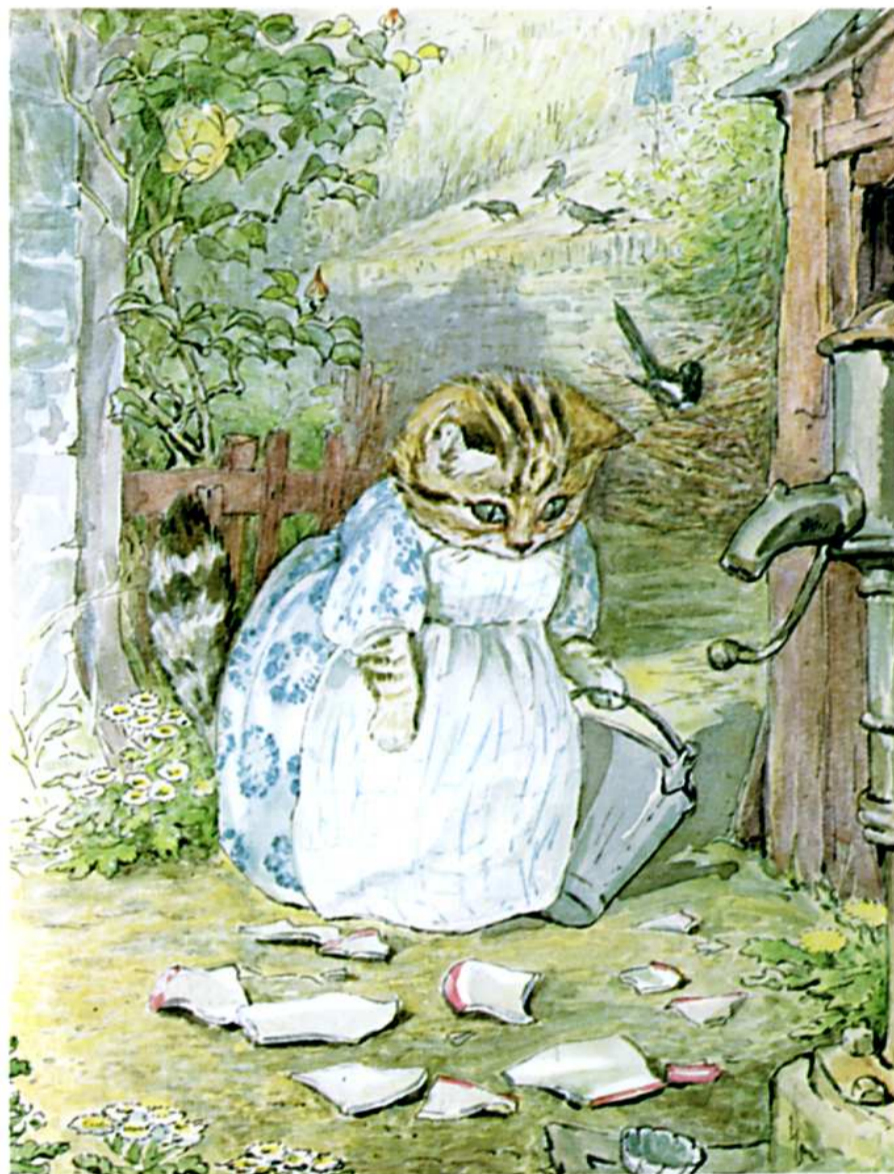
SO THERE REALLY WAS A PATTY-PAN

Коли Смужка вийшла за відром води, щоб вимити чайний посуд, вона побачила рожево-білу форму для пирога, що лежала розбитою посеред двору. Хорма стояла під насосом, де її недбало залишив доктор Магготті.