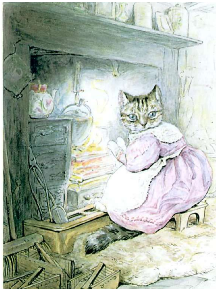
READY FOR THE PARTY

Вона сіла перед вогнем і почала чекати на песика. "Я рада, що скористалася нижньою духовкою, - сказала Смужка, - верхня, напевно, була б дуже гарячою. Цікаво, чому дверцята шафи були відчинені? Невже в будинку хтось був?"