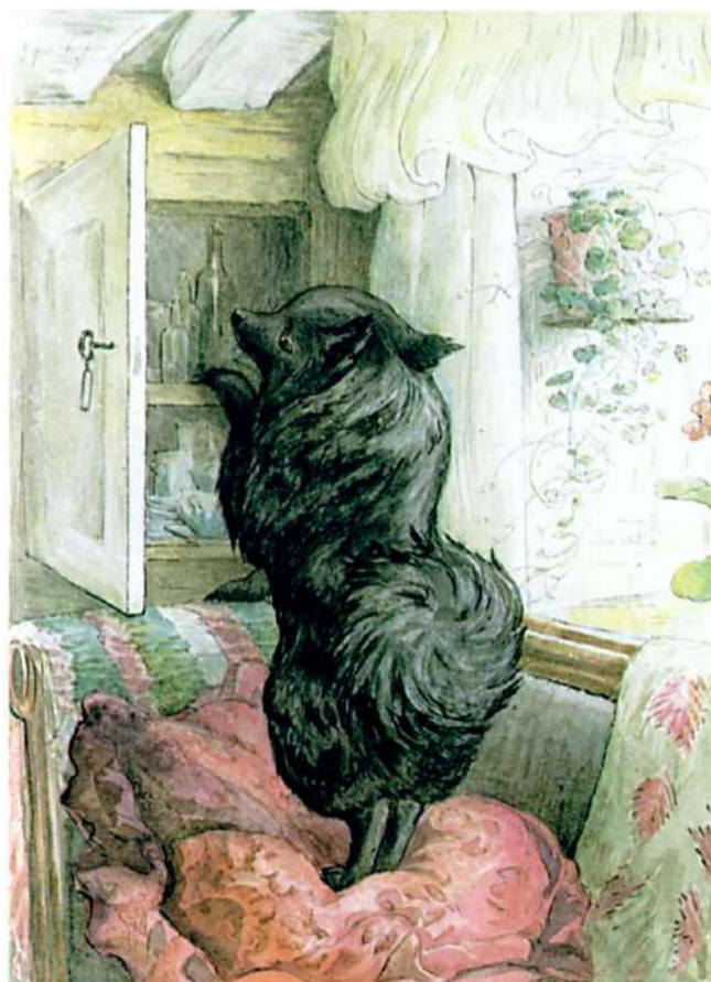
WHERE IS THE PIE MADE OF MOUSE ?

Смужка пішла до Тімоті Бейкера і купила кекси. Потім вона пішла додому. Коли вона йшла до будинку, то почула якийсь шум у дворі, коли вона входила через парадні двері. "Сподіваюся, ніхто не поцупив мій пиріг. Добре хоч ложки замкнені в надійному місці", - сказала Смужка. Але там нікого не було. Тоді Смужка з трудом відчинила нижні дверцята духовки і перевернула пиріг. Звідти долинув приємний запах печеної миші!