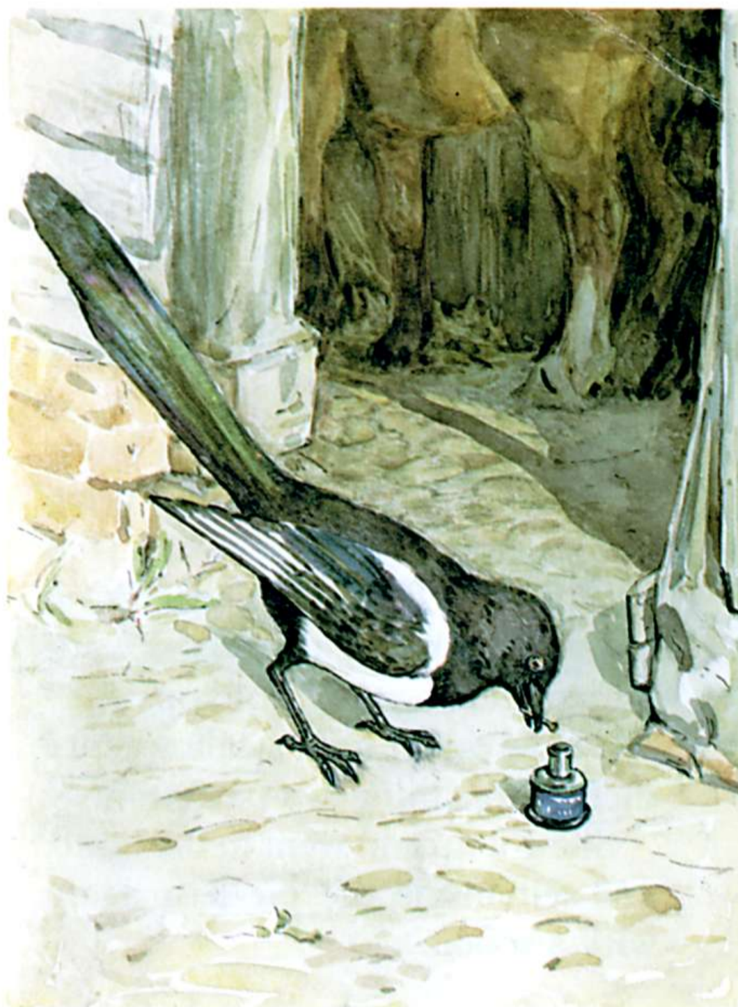
DR. MAGGOTTY'S MIXTURE

"Дурниця? ФА!" - сказав він і охоче пішов за кішкою.