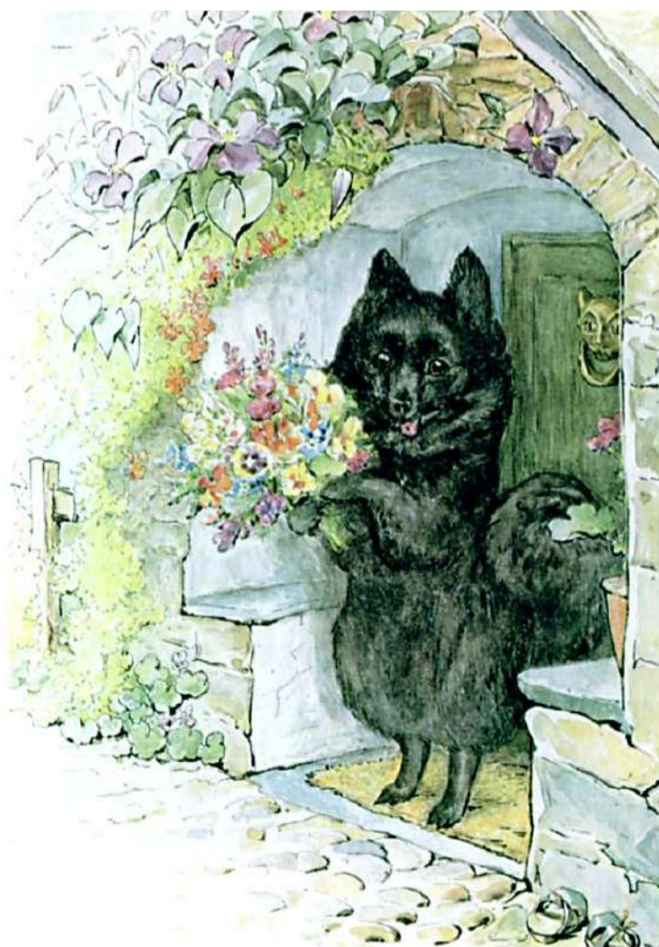
DUCHESS IN THE PORCH

"Дуже добре, дякую, а як ти поживаєш, моя люба Смужко?" - сказала Герцогиня. "Я принесла тобі квіти; як смачно пахне пирогом!"