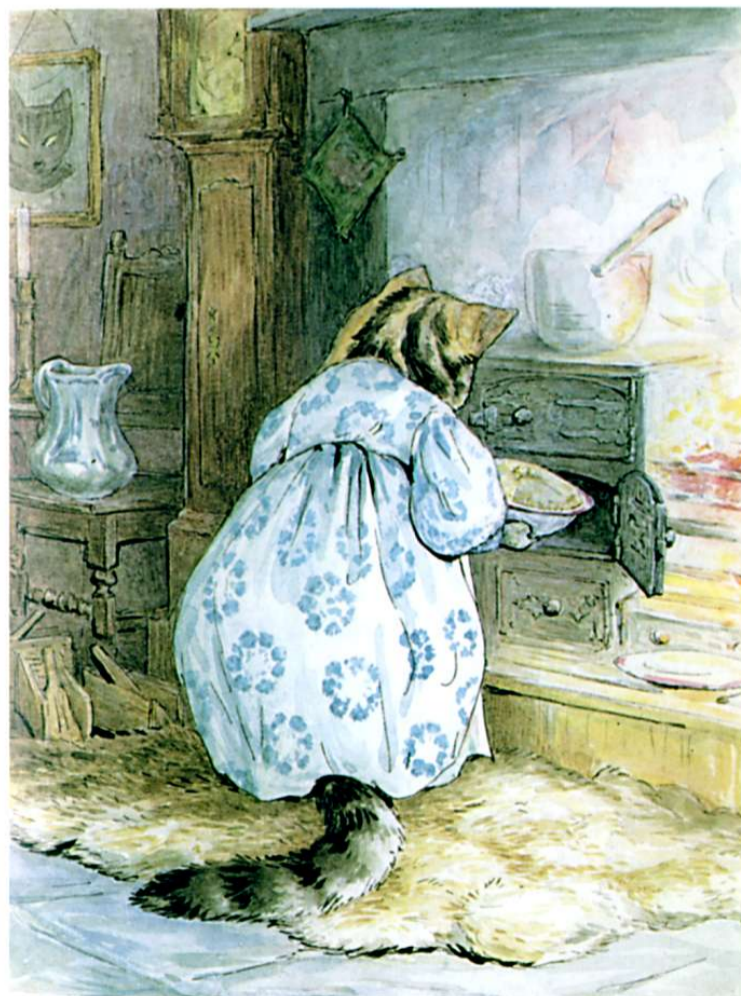
THE PIE MADE OF MOUSE

Герцогиня була в захваті від власної кмітливості! Тим часом Смужка отримала відповідь Герцогині, і як тільки вона переконалася, що песик прийде, вона запхала свій пиріг у піч. Духовок було дві, одна над іншою; деякі ручки були лише декоративними і не призначалися для відкривання. Смужка поклала пиріг у нижню духовку, дверцята якої були дуже жорсткими.