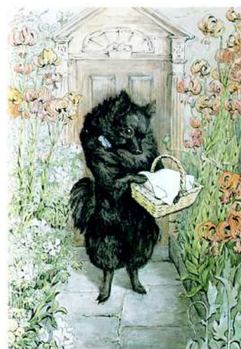
THE VEAL AND HAM PIE

І якраз в той самий час Герцогиня вийшла зі свого будинку на іншому кінці села.