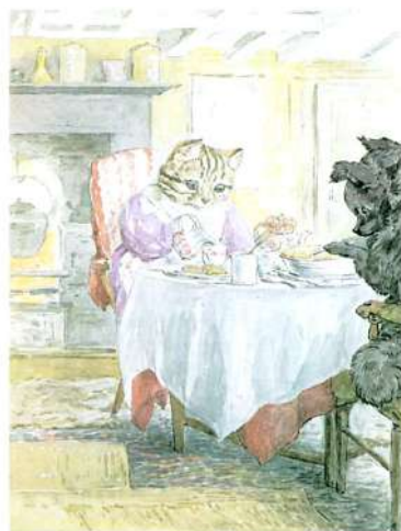
WHERE IS THE PATTY-PAN ?

"Дякую, моя люба Смужко, я тільки хотіла взяти форму".