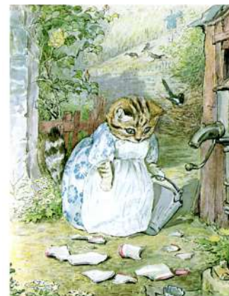
SO THERE REALLY WAS A PATTY-PAN

Коли Смужка вийшла за відром води, щоб вимити чайний посуд, вона побачила рожево-білу форму для пирога, що лежала розбитою посеред двору. Хорма стояла під насосом, де її недбало залишив доктор Магготті.