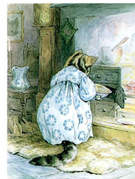
THE PIE MADE OF MOUSE

Герцогиня була в захваті від власної кмітливості! Тим часом Смужка отримала відповідь Герцогині, і як тільки вона переконалася, що песик прийде, вона захпала свій пиріг у піч. Духовок було дві, одна над іншою; деякі ручки були лише декоративними і не призначалися для відкривання. Смужка поклала пиріг у нижню духовку, дверцята якої були дуже жорсткими.