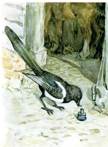
DR. MAGGOTTY'S MIXTURE

"Дурниця? ФА!" – сказав він і охоче пішов за кішкою.