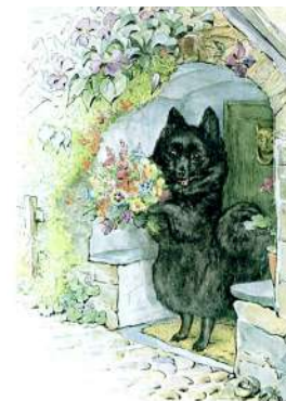
DUCHESS IN THE PORCH

"Дуже добре, дякую, а як ти поживаєш, моя люба Смужко?" - сказала Герцогиня. "Я принесла тобі квіти; як смачно пахне пирогом!"