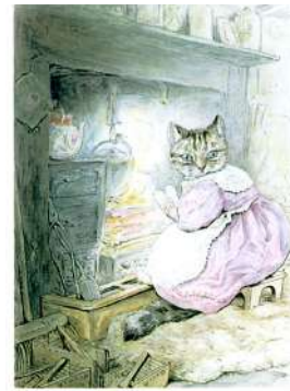
READY FOR THE PARTY

Вона сіла перед вогнем і почала чекати на песика. "Я рада, що скористалася нижньою духовкою, - сказала Смужка, - верхня, напевно, була б дуже гарячою. Цікаво, чому дверцята шафи були відчинені? Невже в будинку хтось був?"