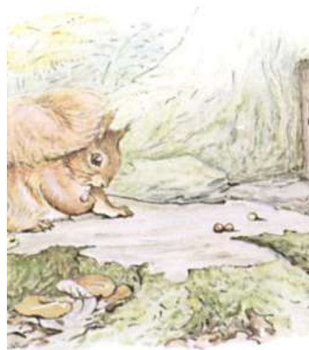
Page 14 of 28

Ils pagayaient sur le lac et atterrissaient sous un marronnier tordu sur l'île des chouettes.