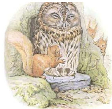
Page 8 of 28

Mais Nutkin était excessivement impertinent dans ses manières. Il sautillait de haut en bas comme une petite cerise rouge, en chantant... « Devinez-moi, devinez-moi, pourri-tot-tote ! Un petit bonhomme, dans un manteau rouge, rouge ! Un bâton à la main et une pierre dans la gorge ; Si vous me disait cette énigme, je vous donnerais un gruu » Maintenant cette énigme était aussi vieille que les collines ; M. Marron n'avait prêté aucune attention à Nutkin. Il fermait obstinément les yeux et s'endormait.