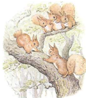
Page 28 of 28