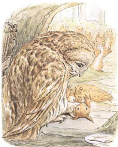
Page 27 of 28

Vieux Marron portait Nutkin dans sa maison et le tenait par la queue, dans l'intention de l'écorcher ; mais Nutkin tirait si fort jusqu'à ce que sa queue se fût cassée en deux, et il courait dans l'escalier et échappait par la fenêtre du grenier.