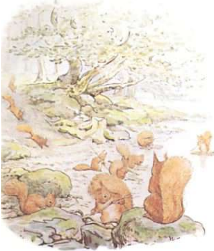
Page 5 of 28

Un automne, alors que les noix étaient mûres et que les feuilles des noisetiers étaient dorées et vertes, Nutkin et Twinkleberry et tous les autres petits écureuils sortaient du bois et descendaient jusqu'au bord du lac.