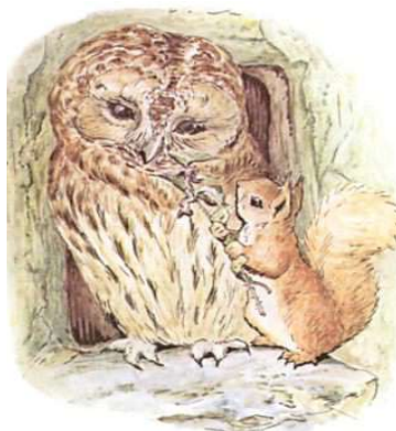
Page 11 of 28

M. Marron réveillait soudainement et transportait la taupe dans sa maison.