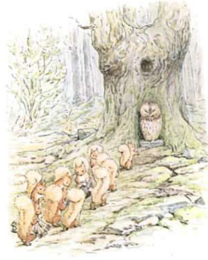
Page 10 of 28