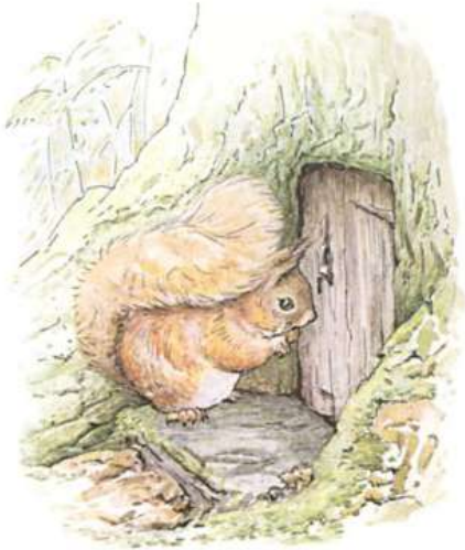
Page 13 of 28

Les écureuils cherchaient des noix dans toute l'île et remplissaient leurs petits sacs. Mais Nutkin cueillait des pommes de chêne jaunes et écarlates et s'assoyait sur une souche de hêtre en jouant aux billes et en surveillant la porte du vieux M. Marron.