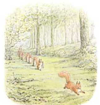
Page 16 of 28

Ce qui était ridicule de la part de Nutkin, car il n'avait pas de bague à donner à M. Vieux Marron.