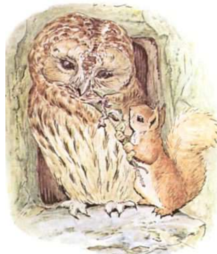
Page 12 of 28

« Une maison pleine, un trou plein ! Et vous ne pouvez pas cueillir un bol plein ! »