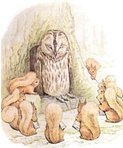
Page 7 of 28

Ils avaient également emporté avec eux une offrande de trois grosses souris comme cadeau pour M. Vieux Marron, et les déposaient sur le pas de sa porte. Puis Twinkleberry et les autres petits écureuils se penchaient profondément et disaient poliment : « M. Vieux Marron, accorderez- nous la permission de cueillir des noix sur votre île ? »