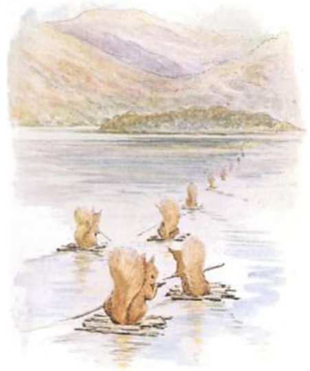
Page 6 of 28

Chaque écureuil avait un petit sac et une grande rame, et il déployait sa queue en guise de voile.