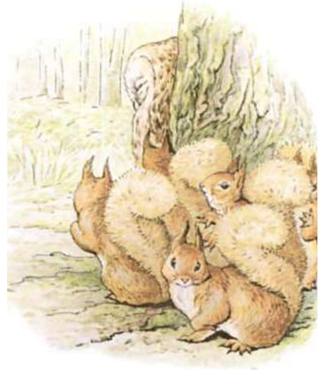
Page 26 of 28

Cela ressemble à la fin de l'histoire ; mais ce n'est pas le cas.