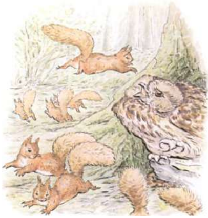
Page 25 of 28

Quand ils étaient revenu très prudemment, regardant autour de l'arbre, ils voyaient M. Vieux Marron assis sur le pas de sa porte, immobile, les yeux fermés, comme si rien n'était. Mais Nutkin était dans la poche de son gilet !