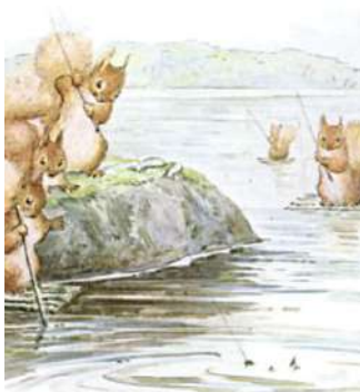
Page 15 of 28

Twinkleberry et six autres petits écureuils portaient chacun un gros vairon ; mais Nutkin, qui n'avait pas de belles manières, n'apportait aucun cadeau. Il courrait vers le devant en chantant... « L'homme dans le désert m'a disait : Combien de fraises poussent dans la mer ? Je lui ai répondu après avoir pensé bien Autant de harengs rouges qui poussent dans le bois » Mais le vieux M. Marron s'intéressait pas aux énigmes, pas même lorsque la réponse lui était fournie.