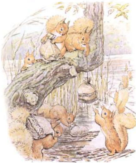
Page 9 of 28

Les écureuils remplissaient leurs petits sacs de noix et rentraient chez eux le soir.