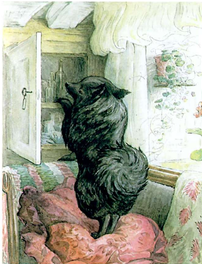
WHERE IS THE PIE MADE OF MOUSE ?

Ribby foi até a casa de Timothy Baker e comprou os muffins. Então ela foi para casa. Parecia haver uma espécie de barulho de luta na passagem dos fundos, quando ela estava entrando pela porta da frente. "Acho que não é aquela torta: as colheres estão trancadas, no entanto", disse Ribby. Mas não havia ninguém lá. Ribby abriu a porta inferior do forno com alguma dificuldade e virou a torta. Começou a haver um cheiro agradável de rato assado!