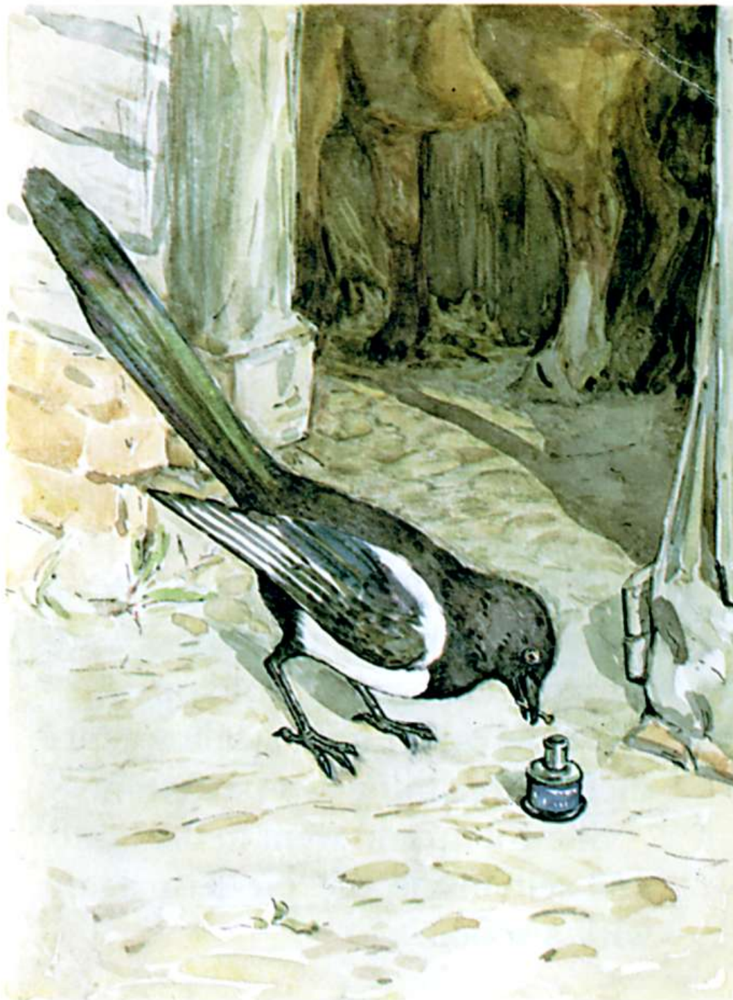
DR. MAGGOTTY'S MIXTURE

"Lata de espinafre? ha! HA!" disse ele, e acompanhou-a com entusiasmo.