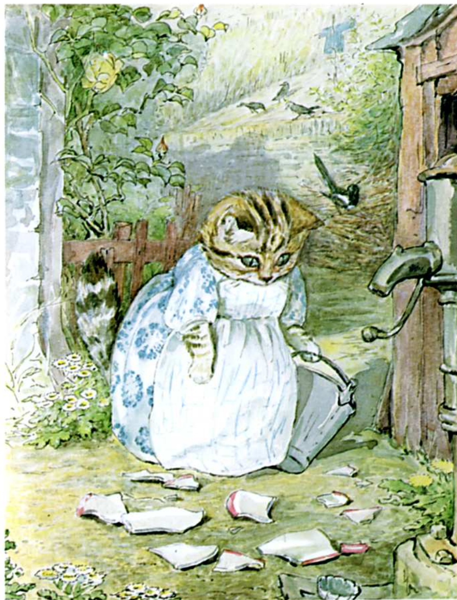
SO THERE REALLY WAS A PATTY-PAN

Quando Ribby saiu para pegar um balde de água para lavar os talheres de chá, ela encontrou uma assadeira rosa e branca quebrada no meio do quintal. A lata de suporte estava embaixo da bomba, onde o Dr. Maggotty o havia cuidadosamente deixado.