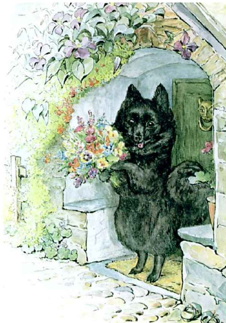
DUCHESS IN THE PORCH

"Muito bem, obrigado, e como vai, minha querida Ribby?" disse a Duquesa. "Eu trouxe algumas flores para você; que cheiro delicioso de torta!"