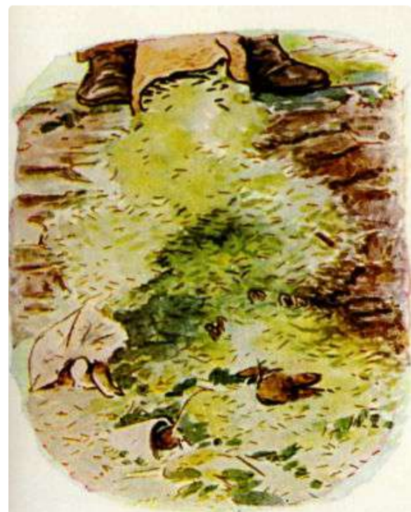
Page 12 of 28

Enquanto ela e Benjamin conversavam, perto da parede, eles ouviram passos pesados acima de suas cabeças; e de repente o Sr. McGregor esvaziou um saco cheio de grama cortada bem em cima dos Coelhoinhos Flopsy adormecidos! Benjamin encolheu-se sob o saco de papel. A ratazana se escondeu em um pote de geléia.