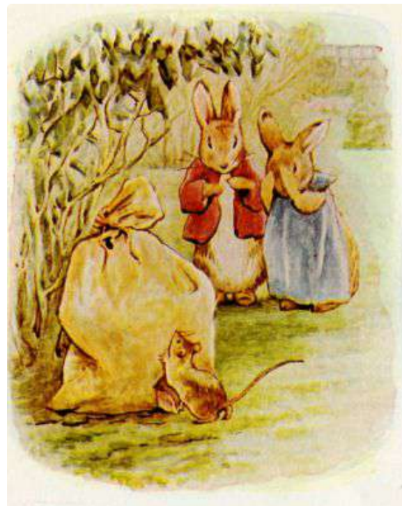
Page 16 of 28

Ela olhou desconfiada para o saco e se perguntou onde estavam todos.