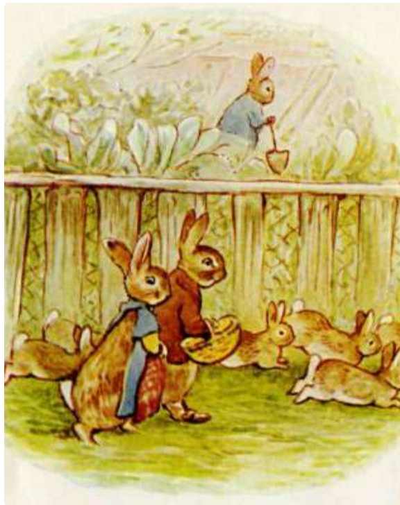
Page 5 of 28

Como nem sempre havia o suficiente para comer, Benjamin costumava pedir repolhos emprestados do irmão de Flopsy, Peter Rabbit, que mantinha uma horta.