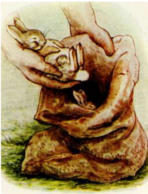
Page 13 of 28

Os coelhinhos sorriam docemente em seu sono sob a chuva de grama; eles não acordaram porque as alfaces estavam tão soníferas. Eles sonharam que sua mãe Flopsy os estava aconchegando em uma cama de feno. O Sr. McGregor olhou para baixo depois de esvaziar o saco. Ele viu algumas pontinhas marrons e engraçadas de orelhas saindo da grama cortada. Ele os encarou por algum tempo.