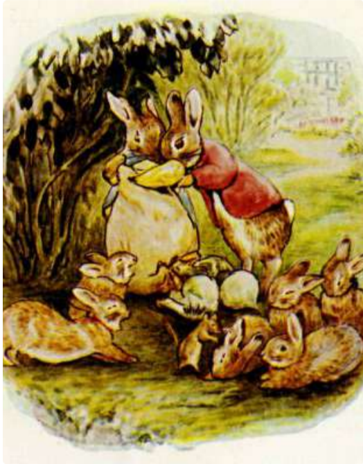
Page 17 of 28

Mas a Sra. Tittlemouse era uma ratinha cheia de recursos. Ela mordiscou um buraco no canto de baixo do saco.