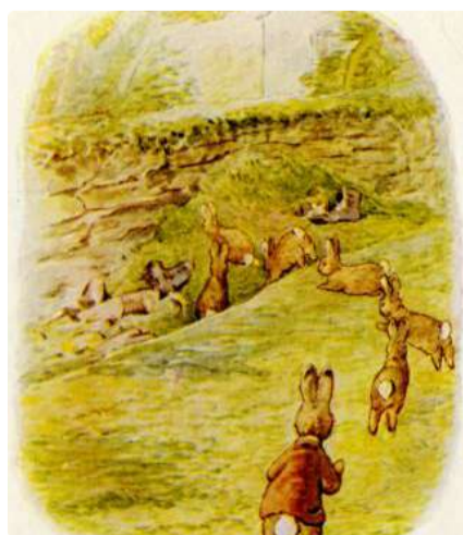
Page 7 of 28

A pilha de lixo do Sr. McGregor era uma mistura. Havia potes de geléia e sacos de papel, montanhas de grama cortada da máquina de cortar grama (que sempre tinha gosto de óleo), algumas abobrinhas podres e uma ou duas botas velhas. Um dia — que alegria! — havia uma quantidade de alfaces que cresceram demais e haviam “desabrochado” em flor.