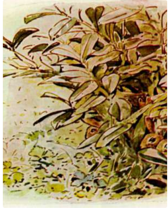
Page 18 of 28

Seus pais encheram o saco vazio com três abobrinhas podres, uma velha escova para graxa e dois nabos estragados.