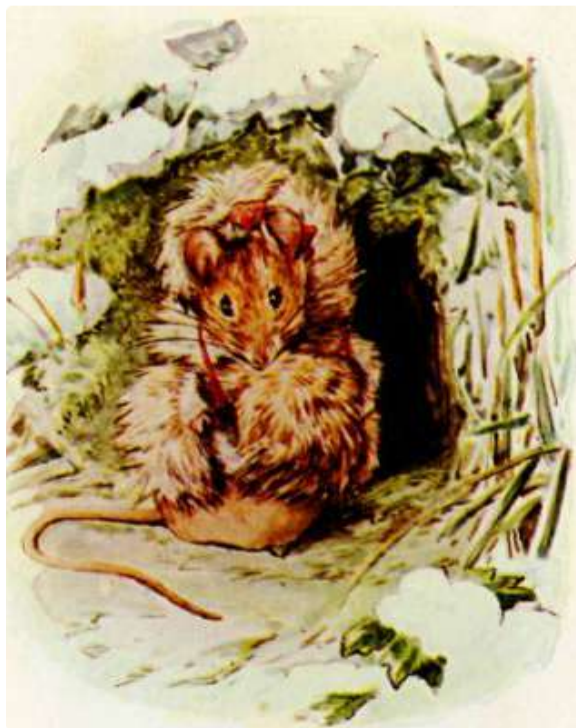
Page 27 of 28

Então Benjamin e Flopsy decidiram que era hora de ir para casa.