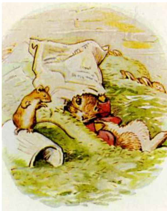
Page 11 of 28

A camundonga se desculpou profundamente e disse que conhecia Peter Rabbit.