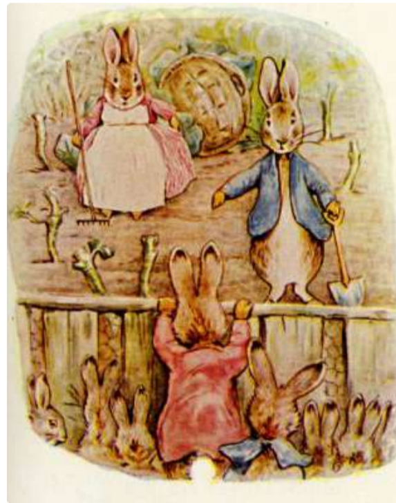
Page 6 of 28

Às vezes, Peter Rabbit não tinha repolhos sobrando.