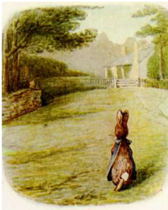
Page 15 of 28

Ele foi guardar a máquina de cortar grama.