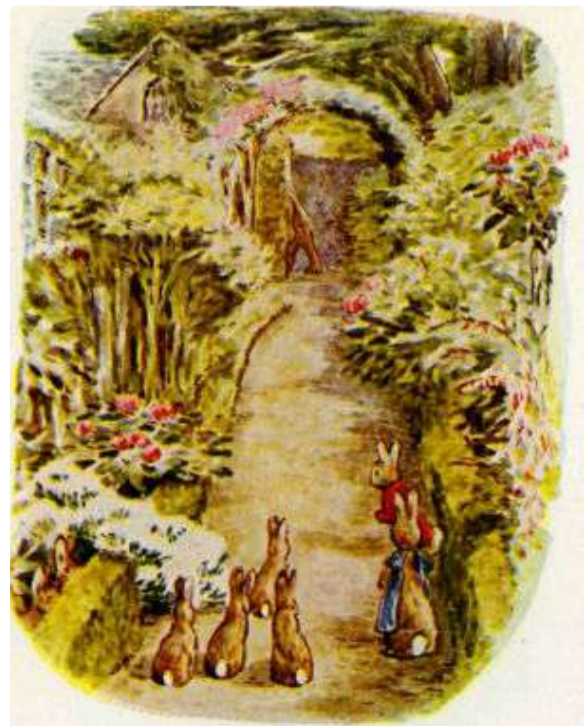
Page 20 of 28