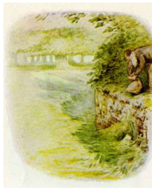
Page 14 of 28

"Um dois três quatro! cinco! seis coelhos pequenos!" disse ele enquanto os colocava em seu saco. Os Coelhinhos Flopsy sonharam que sua mãe os estava virando na cama. Eles se mexeram um pouco durante o sono, mas ainda não acordaram.