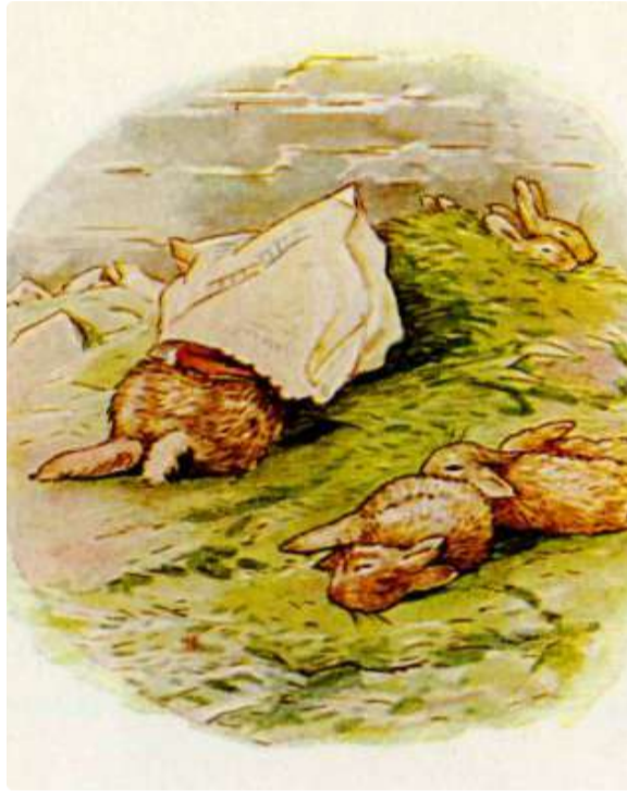
Page 9 of 28

Benjamin não ficou tão afetado quanto seus filhos. Antes de dormir, ele estava suficientemente acordado para colocar um saco de papel na cabeça para afastar as moscas.