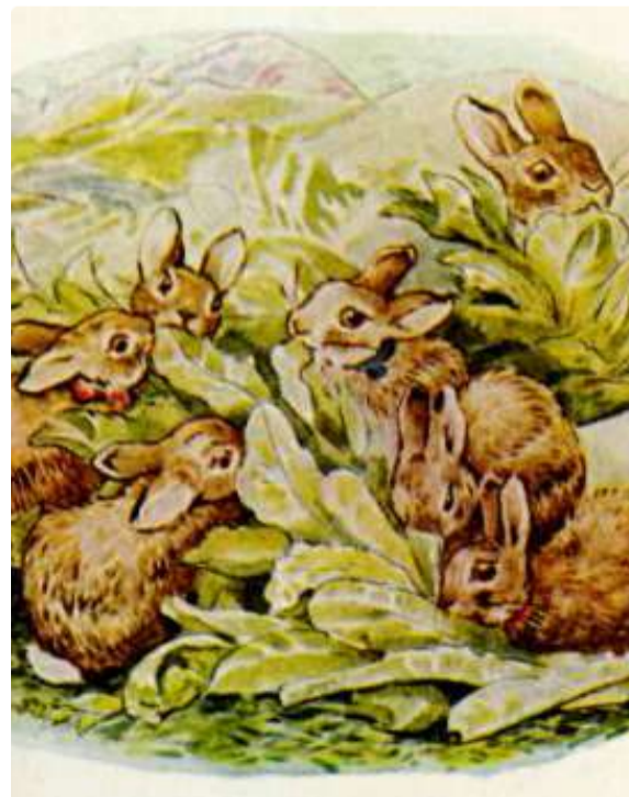
Page 8 of 28

Os Coelhoinhos Flopsy simplesmente se encheram de alfaces. Pouco a pouco, um após o outro, foram dominados pelo sono e deitaram-se na grama aparada.