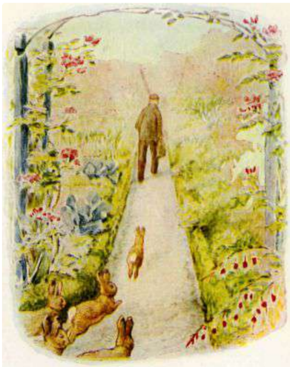
Page 19 of 28

Os Coelhinhos Flopsy o seguiram de uma distância segura.