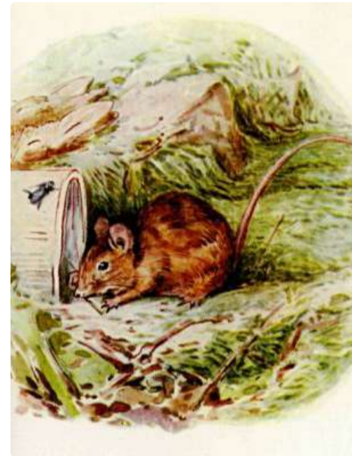
Page 10 of 28

Os Coelhoinhos Flopsy dormiram deliciosamente sob o sol quente. Do gramado além do jardim veio o som distante e estridente da máquina de cortar grama. As varejeiras zuniam em volta da parede e uma ratinha velha remexia no lixo entre os potes de geléia. (Posso lhe dizer o nome dela, ela se chamava Thomasina Tittlemouse, uma ratazana com uma longa cauda.)