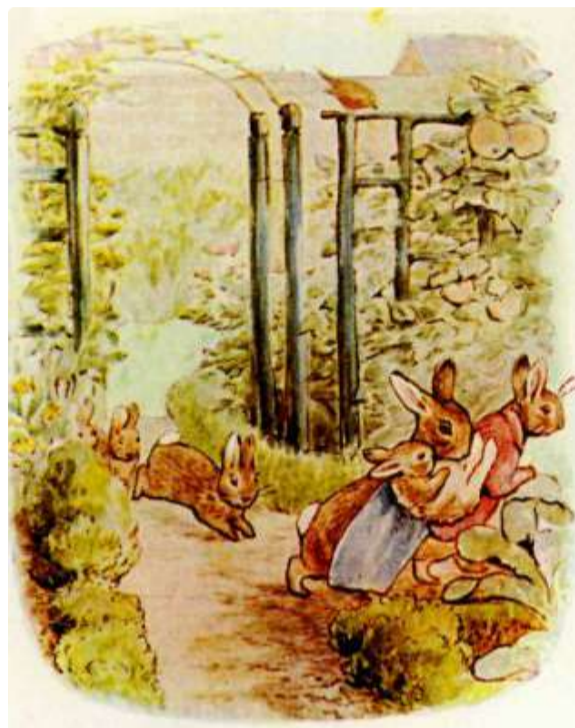
Page 26 of 28

Então Benjamin e Flopsy decidiram que era hora de ir para casa.