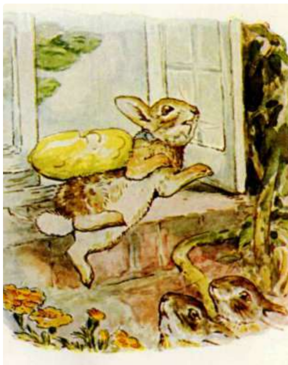
Page 25 of 28

Quando ela sentiu os vegetais, ela ficou muito brava. Ela disse que o Sr. McGregor tinha "feito isso de propósito".