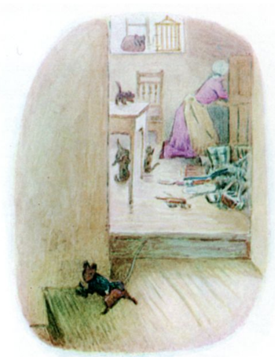
Page 25 of 28

Hij legde uit waarom hij zo vroeg in het seizoen op bezoek kwam: het gezin was met Pasen naar de zee gegaan. De kok was bezig met de voorjaars schoonmaak aan boord, voor veel loon, en met de speciale instructies om de muizen op te ruimen. Er waren vier kittens en de kat had de kanarie al gedood.