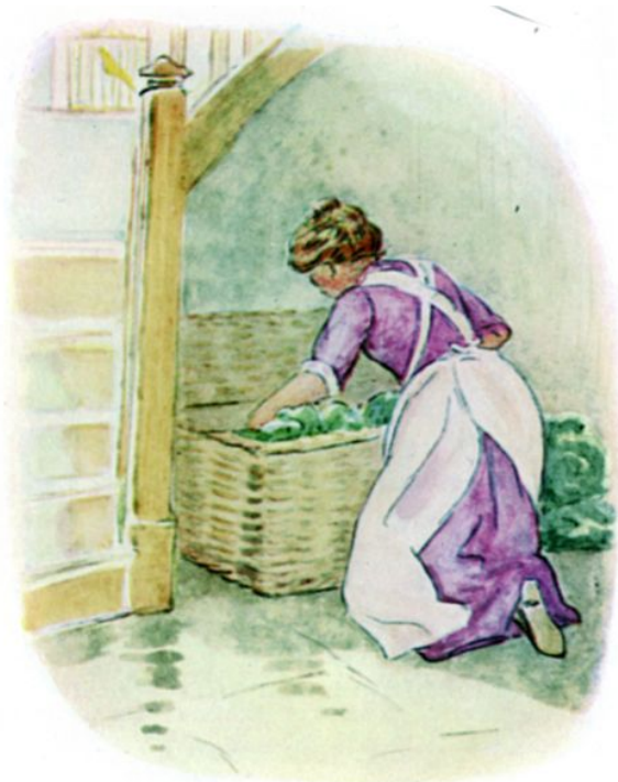
Page 7 of 28

Timmy Willie, die zijn hele leven in een tuin had gewoond, was doodsbang. Weldra opende de kok de mand en begon de groenten er uit te pakken. De doodsbange Timmy Willie sprong eruit.