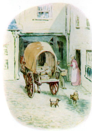
Page 6 of 28

Eindelijk stopte de kar bij een huis, waar de mand van de kar werd gehaald, naar binnen werd gedragen en neergezet. De kok gaf de koerier zes muntstukken. De achterdeur bonsde dicht en de kar denderde weg. Maar er was geen stilte in het huis, het leek wel alsof honderden karren het huis passeerden. Honden blaften, jongens floten op straat, de kok lachte, het kamermeisje rende de trappen op en af en een kanarie zong als een stoommachine.