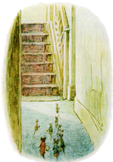
Page 15 of 28

De volgende dag verliep hetzelfde. Er werd een uitstekend ontbijt verzorgd, althans voor muizen die gewend waren spek te eten. Maar Timmy Willie was grootgebracht met wortels en sla. Johnny de Stadsmuis en zijn vrienden scharrelden onder de vloeren rond en liepen 's avonds brutaal door het hele huis. Een bijzonder luide knal werd veroorzaakt doordat Sarah met het theeblad naar beneden viel. Maar er waren kruimels, suiker en hapjes jam te verzamelen, ondanks de kat.