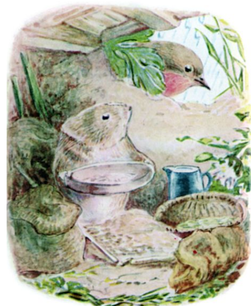
Page 16 of 28

Timmy Willie verlangde ernaar om thuis te zijn in zijn vredige nest op een zonnige oever. Het eten was niet zijn smaak en het lawaai belette hem te slapen. Binnen een paar dagen werd hij zo mager dat Johnny de Stadsmuis het opmerkte en hem wat vragen stelde. Hij luisterde naar het verhaal van Timmy Willie en informeerde naar de tuin. "Het klinkt nogal als een saaie plek? Wat doe je als het regent?"