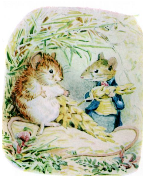
Page 27 of 28

"Ik weet zeker dat je nooit meer in de stad wilt wonen", zei Timmy Willie.