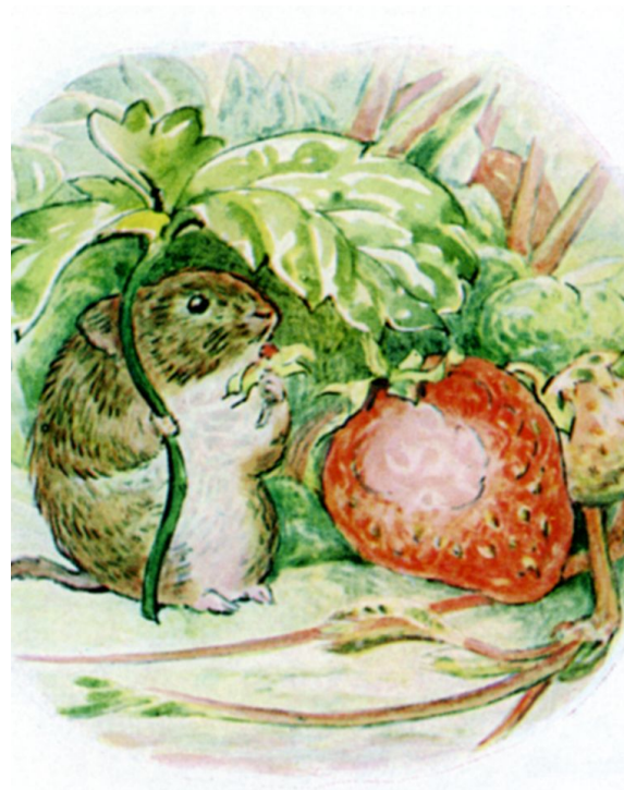
Page 28 of 28

De ene plek past bij de ene persoon, de andere plek bij de andere persoon. Persoonlijk woon ik ook liever op het platteland, net zoals Timmy Willie!