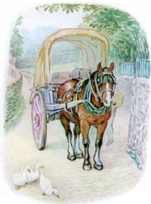
Page 5 of 28

Hij werd geschrokken wakker terwijl de mand in de kar van de koerier werd getild. Toen was er een schok en een gekletter van paardenvoeten, andere pakketten werden in de kar gegooid en zo ging het verder voor mijlen en mijlen lang, -schok-schok-schokker-de-schok-, en Timmy Willie zat bevend tussen de door elkaar gegooid groenten.