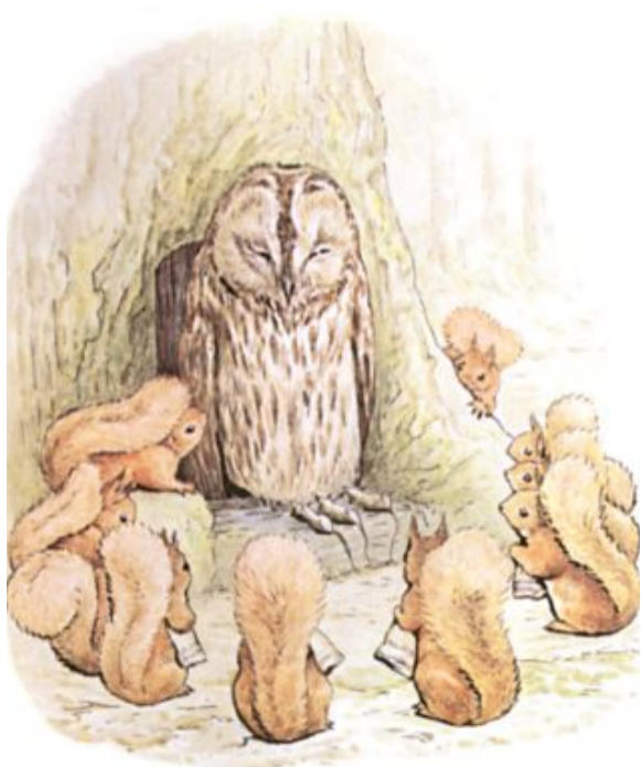
Page 7 of 29

Ze namen drie dikke muizen mee als geschenk voor Spikkel de Uil. Ze legden de muizen neer op de stoep voor het huis van de uil. Met een diepe buiging vroegen Springvoet en de eekhoorns aan Spikkel de Uil beleefd om zijn toestemming voor het verzamelen van noten op het eiland.