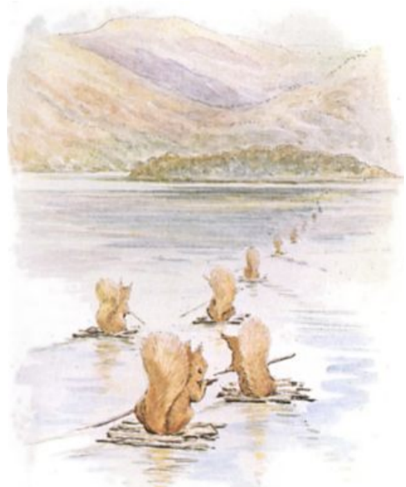
Page 6 of 29

Daar maakten ze vloten van de takken van de bomen. Ze gebruikten de vloten om bij het eiland van Spikkel de Uil te komen om er noten te verzamelen.