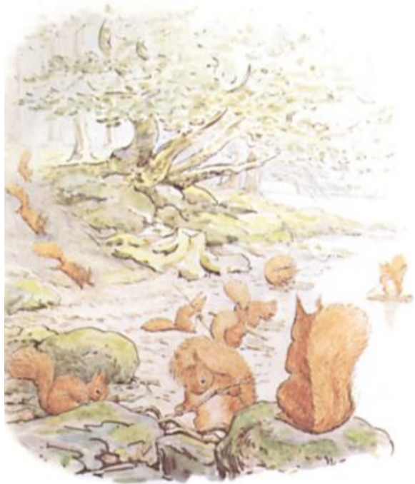
Page 5 of 29

Het werd herfst en de bladeren van de hazelaar werden prachtig goud van kleur. Het betekende dat de noten rijp genoeg om te eten waren. Hakketak, Springvoet en alle andere eekhoorns verzamelden zich bij de oever van het meer.