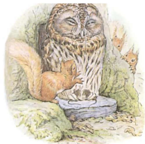
Page 8 of 29

Het was een flauw raadseltje en Spikkel de Uil gaf er geen aandacht aan. Hij sloot ongeïnteresseerd zijn ogen en ging een dutje doen.