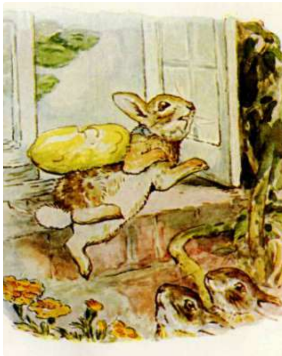
Page 25 of 28

Mevrouw McGregor maakte de zak open en stak haar hand erin. Toen ze de groenten voelde, werd ze heel erg boos. Ze zei dat meneer McGregor dit met opzet had gedaan.