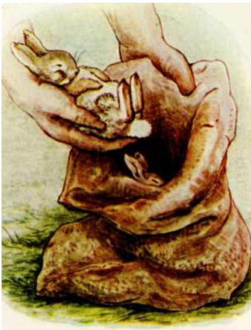
Page 13 of 28

De Konijntjes glimlachten lief in hun slaap, onder de regen van gras. Ze werden niet wakker omdat de sla zo slaapverwekkend was geweest. Ze droomden dat hun moeder Flopsy hen in een hooibed stopte. Meneer McGregor keek naar beneden nadat hij zijn zak had gelegd. Hij zag een paar grappige, bruine oorpunten door het gras naar boven steken. Hij staarde er een tijdje naar.