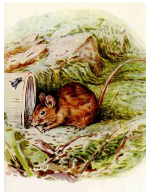
Page 10 of 28

De kleine Flopsy Konijntjes sliepen heerlijk in de warme zon. Opeens klonk er, in de verte, vanaf het grasveld achter de tuin, het ratelende geluid van de maaimachine. De bromvliegen zoemden langs de muur en een kleine oude muis struinde rond in het afval tussen de jampotten. (Ik kan je haar naam vertellen, ze heette Thomasina Tittlemouse en het was een bosmuis met een lange staart.)