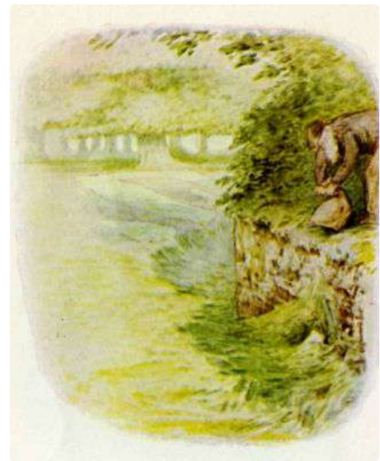
Page 14 of 28

Weldra zat er een vlieg op één van de bruine oorpunten. Toen bewoog er zelfs een oor....Meneer McGregor klom op de vuilnisbelt... "Een, twee, drie, vier, vijf, zes kleine Konijntjes!", riep hij uit terwijl hij ze in een zak liet vallen. De Flopsy Konijntjes bewogen zich een beetje in hun slaap maar werden nog steeds niet wakker. Ze droomden dat hun moeder hen in bed omdraaide.