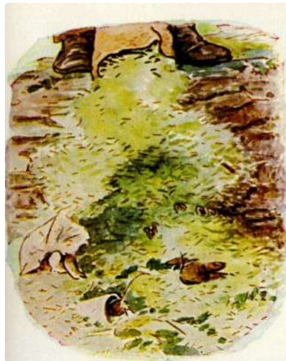
Page 12 of 28

Terwijl zij en Benjamin aan het praten waren, dicht onder de muur, hoorden ze een zware voetstap boven hun hoofden. Plotseling leegde meneer McGregor een zak vol grasmaaisel op de kop van de slapende Flopsy Konijntjes. Benjamin kroop ineen onder zijn papieren zak. De muis verstopte zich snel in een jampot.